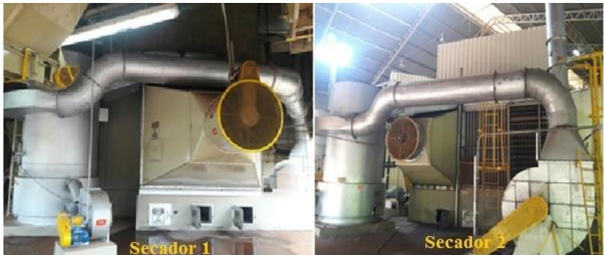
FIGURA 4 – Conjunto de Equipamentos fornecedores e distribuidores da massa de ar quente do secador 1 e 2.